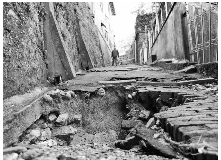
La zona di Fegino, Genova, invaso dal fango.

EXPO, AREA A RISCHIO - Eccolo il simbolo italiano della "rimozione del problema, della mancata coscienza del rischio: è l'Expo 2015, che senza interventi rischia di restare alluvi-